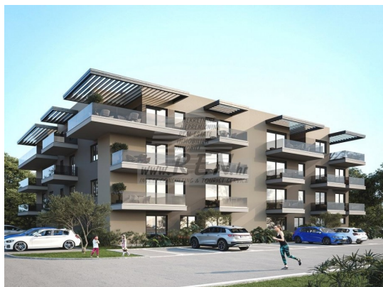
TLOCRT 3. KATA M 1:100